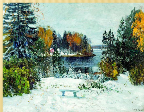
С. Жуковский «Выпал снег»