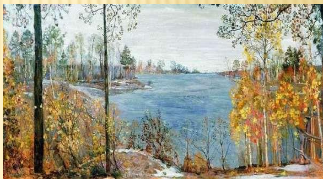
И. Бродский «Поздняя осень»