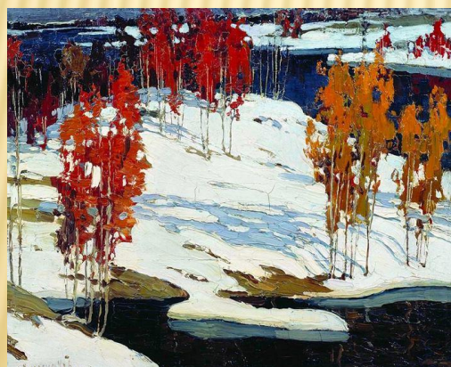
И. Колесников «Первый снег»