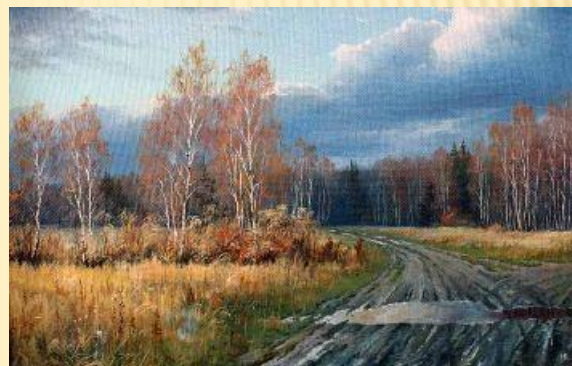
Н. Булыгин «Поздняя осень»