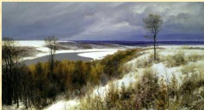
В. Поленов «Ока близ Тарусы»