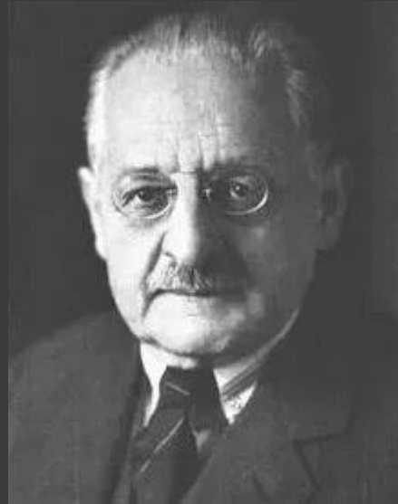
Федор Краузе - немецкий хирург, один из основоположников немецкой нейрохирургии