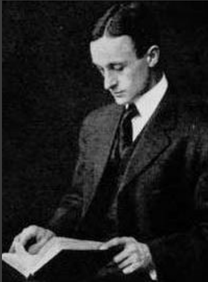
Гарвей Кушинг - известный нейрохирург и пионер хирургии мозга