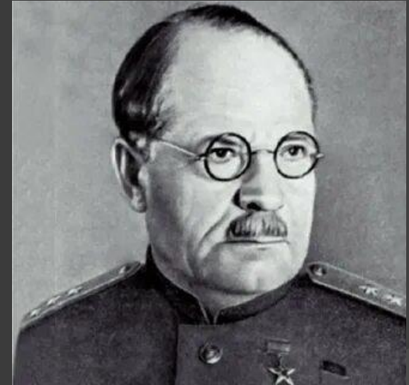
Николай Бурденко - русский и советский хирург, основоположник российской нейрохирургии